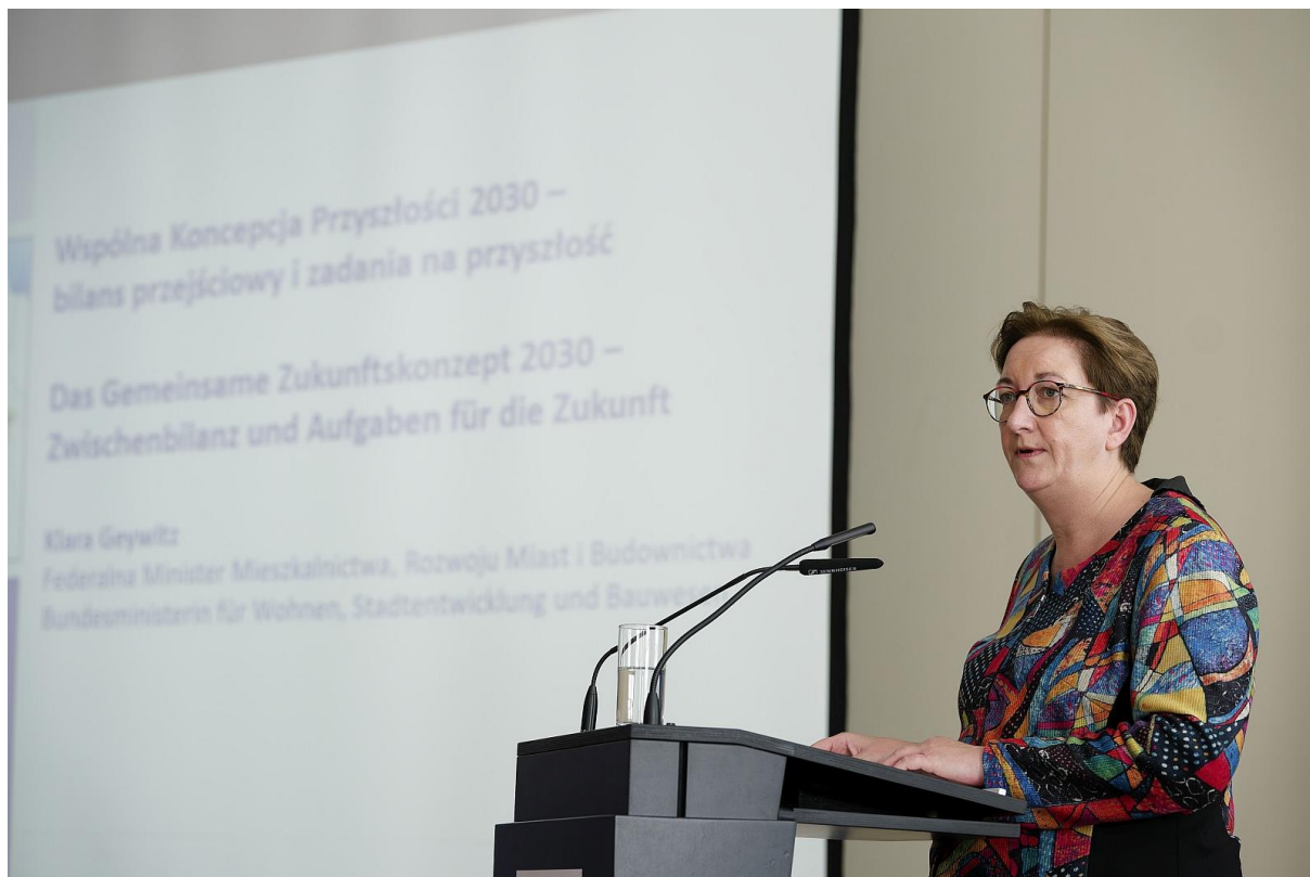
Federalna minister Klara Geywitz podczas swojego przemówienia w sali im. Ernsta Reutera.

Ponadto w centrum uwagi znalazły się wyzwania związane z zarządzaniem regionalnym w czasach kryzysu, a także omówiono nowe pomysły i impulsy do współpracy. Ponadto minister federalna Klara Geywitz przedstawiła perspektywę kolejnego polsko-niemieckiego modelowego przedsięwzięcia ładu przestrzennego.