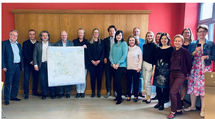
Spotkanie GR ds. Wdrażania w kwietniu 2022 r. we Frankfurcie nad Odrą / Treffen der AG Umsetzung im April 2022 in Frankfurt (Oder)