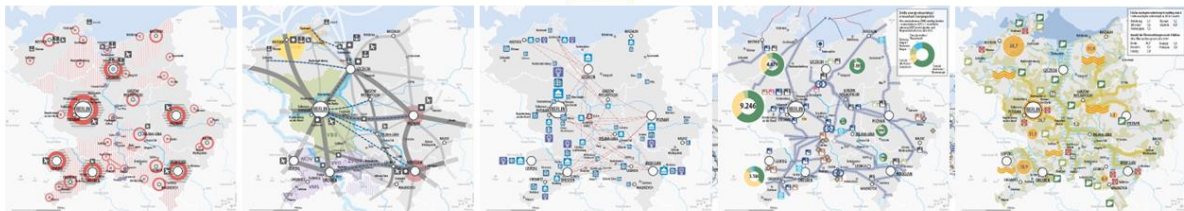
MORO „Zintegrowane planowanie” – Konferencja podsumowująca – Berlin, 28 września 2023 r.