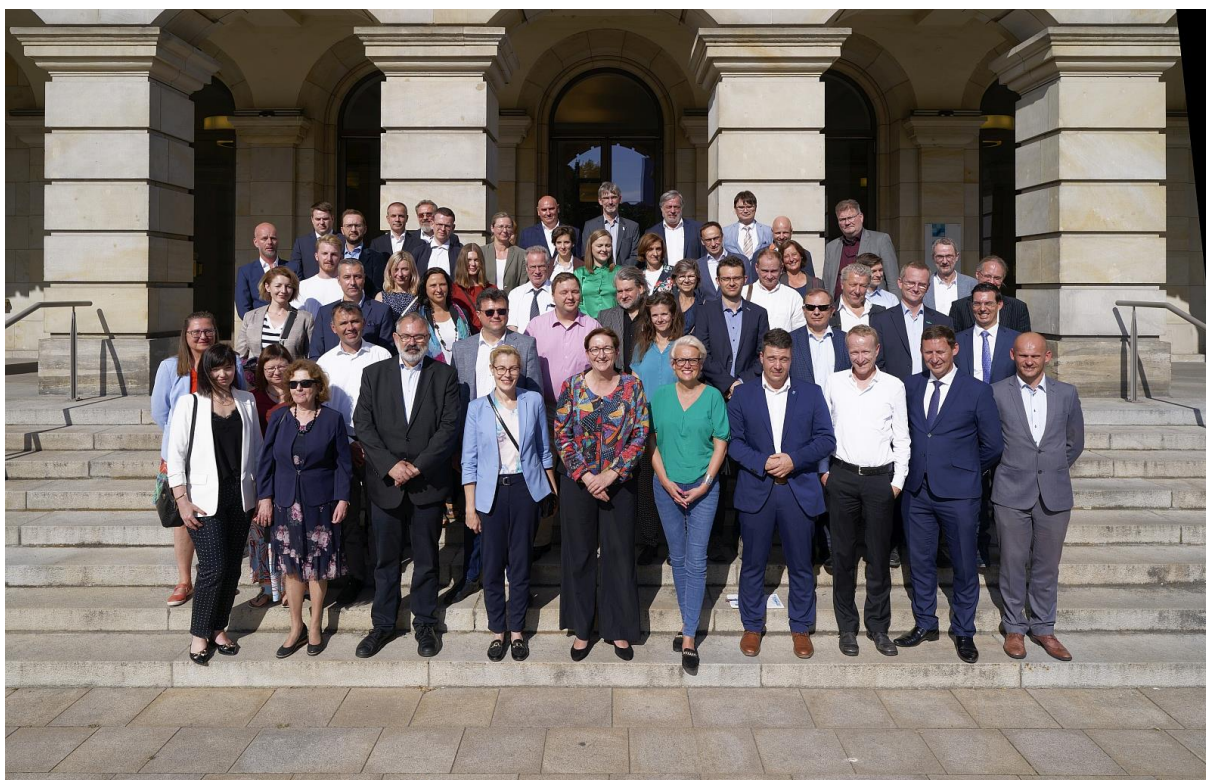
„Zdjęcie rodzinne” z Federalną Minister przed Domem im. Ernsta Reutera.

Po ponad dwóch latach intensywnej współpracy w ramach modelowego przedsięwzięcia ładu przestrzennego (MORO) „Zintegrowane planowanie w polsko-niemieckim obszarze powiązań” Federalne Ministerstwo Mieszkalnictwa, Rozwoju Miast i Budownictwa (BMWSB) oraz Federalny Instytut Badań nad Budownictwem, Miastami i Przestrzenią (BBSR) we współpracy z Komitetem ds. Gospodarki Przestrzennej Polsko-Niemieckiej Komisji Międzyrządowej do spraw Współpracy Regionalnej i Przygranicznej w dniu 28 września 2023 r. w godzinach od 10 do 16 zapraszały na konferencję podsumowującą MORO „Zintegrowane planowanie w polsko-niemieckim obszarze powiązań” w Domu im. Ernsta Reutera w Berlinie, w obecności Pani Klary Geywitz, Federalnej Minister Mieszkalnictwa, Rozwoju Miast i Budownictwa.